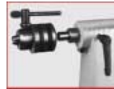
Zahnkranz-Bohrfutter mit Schlüssel und Kegeldorn, Spannweite 2-16 mm