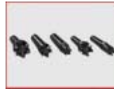
Sechszackmitnehmer kurz D 20, 30, 40