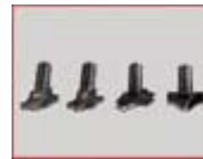
Satz Profilfräser, 4 Stck.