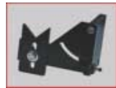
Einlegehilfe für Ringlünette