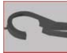
Absaughaube für Ringlünette