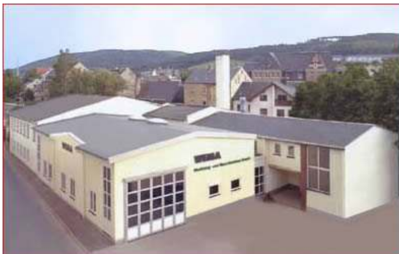
Das Firmengebäude in Olbernhau.

Bereits im Jahre 1994 wurden notwendige bauliche Veränderungen für eine höhere Produktion vorgenommen. Seit Ende 2000 ist noch eine neue Montagehalle in Betrieb genommen worden. Zur gleichen Zeit wurden 1 Schulungsraum, sowie ein Vorführraum ausgebaut und ein großer Kundenparkplatz erstellt.