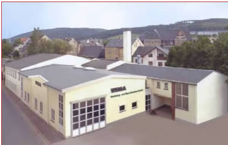
Das Firmengebäude in Olbernhau.

Bereits im Jahre 1994 wurden notwendige bauliche Veränderungen für eine höhere Produktion vorgenommen. Seit Ende 2000 ist noch eine neue Montagehalle in Betrieb genommen worden. Zur gleichen Zeit wurden 1 Schulungsraum, sowie ein Vorführraum ausgebaut und ein großer Kundenparkplatz erstellt.